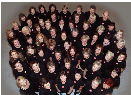
«Vossagospel» heldt konsert for oss i Fusa sokn i 2022 – og dei kjem att i 2023.

Ved ein del gudstenester hadde kantor ansvar for innslag av lokale kor eller solistar. Kyrkjekoret var med på nokre av dei. Koret « Sine Nomine », også leia av kantor, deltek òg på gudstenester m.m. Elles vart det m.a. arrangert 4 julekonsertar i kyrkjene våre, solidaritetskonsert for Ukraina, minikonsert med Fjord'n barnekor, jubileumskonsert for Fusa kyrkje 60 år og gospelkonsert med Vossagospel.