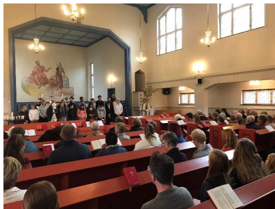
Konfirmantpresentasjon i Fusa kyrkje.

pandemien, men det er likevel ikkje like gode tal som før pandemien.