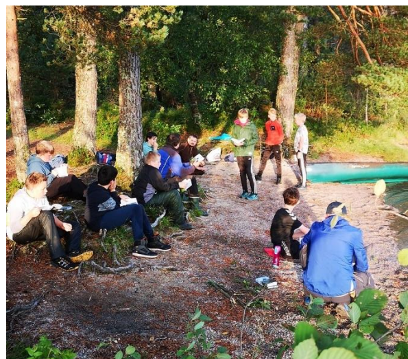
Friluftsklubben NOAH på Klenaneset 2022

NOAH , friluftsklubben for gitar 5.-8. klasse, har i mange år hatt flinke og dedikerte leiarar og bra oppmøte av deltakarar. Eit strålende tiltak som har betydd mykje for ein heil del gitar i mange år.