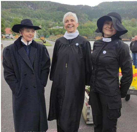
«Walk & Run» 2022: Det skal ikkje stå på prestemangel i Fusa i tida som kjem!