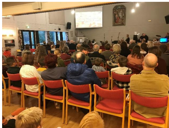
Familiemix på Eikelandsosen bedehus.

Ein del lekmannsgudstenester vart haldne av kyrkjelydspedagogen og av dei skulerte frivillige medarbeidarane, både gudstenesteleiing og forkyning. I nokre bygder er tal deltakarar på vanlege høgmesse lågt, og synkande. Der det ser ut til at me har jamt høgast deltaking er gudstenestene på Eikelandsosen bedehus.