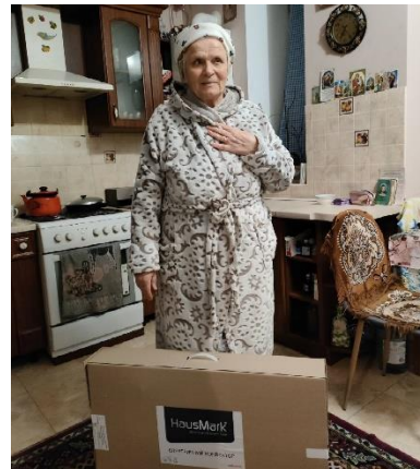
Utdeling av varmeomn til trengande i Ukraina

Besøksteneste - I samarbeid med frivilligsentralen har ein tilbod om besøksteneste. Lokalt er truleg einsemd mellom gamle og sjuke den største diakonale utfordringa me har.