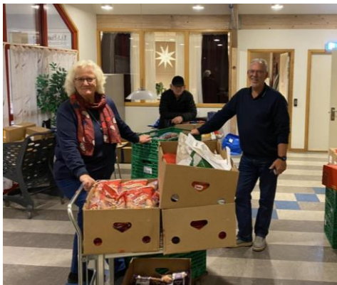
Frivillige pakkar matkassar til jul

Meir enn 30 matkassar med julemat vart delte ut til personar og familiar som hadde meldt behov. Både behovet og givargleda var rekordstort i 2022.